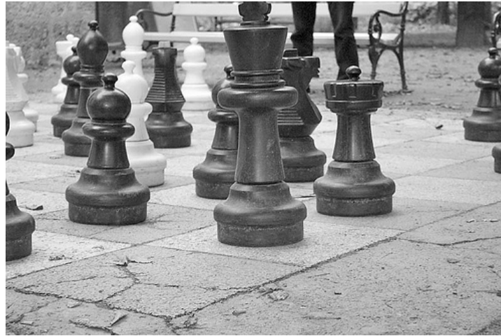
Abbildung 2.1.: Das ist eine Grafik als jpg eingefügt