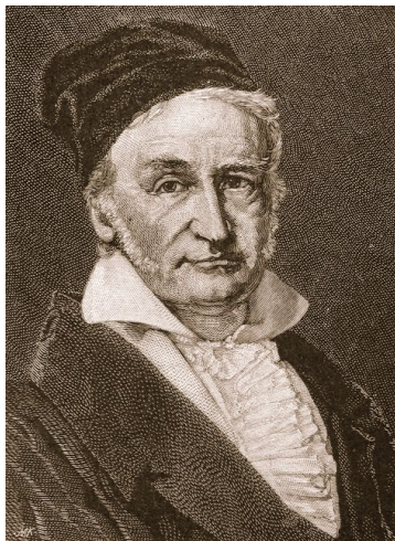
Abbildung 1.2.: Noch ein jpeg-Bild

felis non sodales commodo, lectus velit ultrices augue, a dignissim nibh lectus placerat pede. Vivamus nunc nunc, molestie ut, ultricies vel, semper in, velit. Ut porttitor. Praesent in sapien. Lorem ipsum dolor sit amet, consectetur adipiscing elit. Duis fringilla tristique neque. Sed interdum libero ut metus. Pellentesque placerat. Nam rutrum augue a leo. Morbi sed elit sit amet ante lobortis sollicitudin. Praesent blandit blandit mauris. Praesent lectus tellus, aliquet aliquam, luctus a, egestas a, turpis. Mauris lacinia lorem sit amet ipsum. Nunc quis urna dictum turpis accumsan semper. Lorem ipsum dolor sit amet, consectetur adipiscing elit. Etiam lobortis facilisis sem. Nullam nec mi et neque pharetra sollicitudin. Praesent imperdiet mi nec ante. Donec ullamcorper, felis non sodales commodo, lectus velit ultrices augue, a dignissim nibh lectus placerat pede. Vivamus nunc nunc, molestie ut, ultricies vel, semper in, velit. Ut porttitor. Praesent in sapien. Lorem ipsum dolor sit amet, consectetur adipiscing elit. Duis fringilla tristique neque. Sed interdum libero ut metus. Pellentesque placerat. Nam rutrum augue a leo. Morbi sed elit sit amet ante lobortis sollicitudin. Praesent blandit blandit mauris. Praesent lectus tellus, aliquet aliquam, luctus a, egestas a, turpis. Mauris lacinia lorem sit amet ipsum. Nunc quis urna dictum turpis accumsan semper.