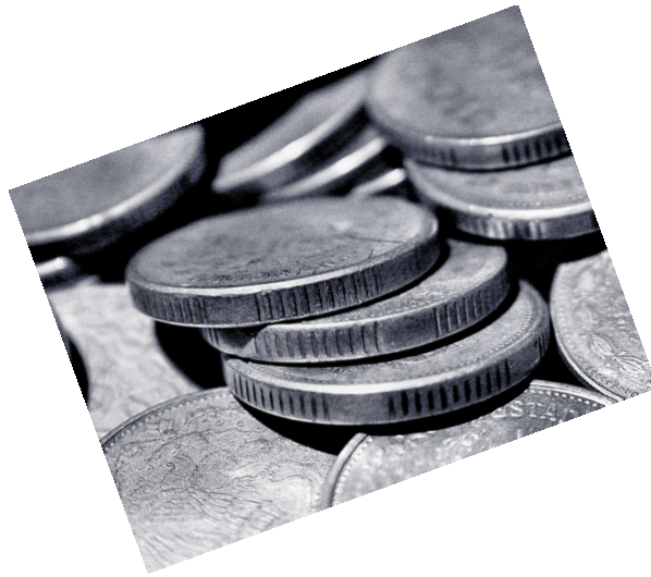
Abbildung 1.1.: Das ist eine Grafik von einer jpeg-Quelle