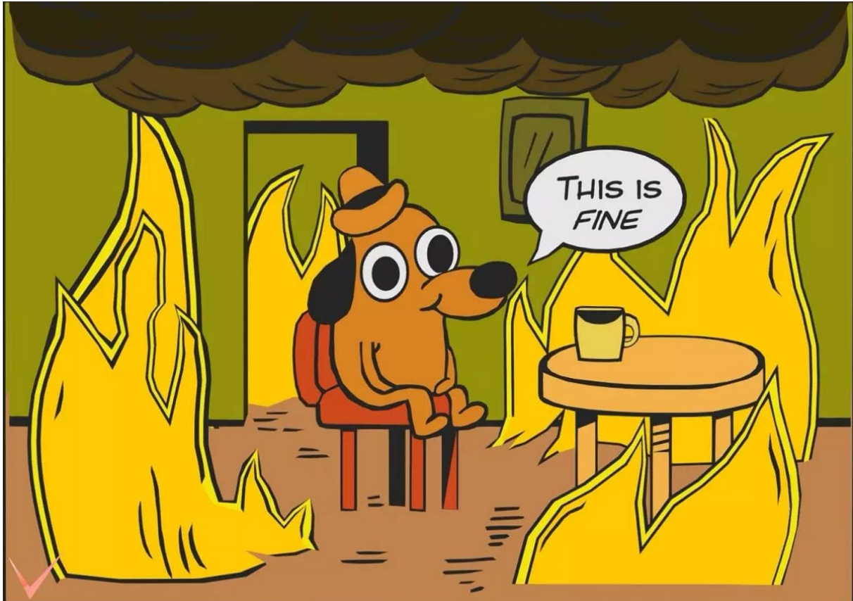
Figure A.1: Figure in Appendix A