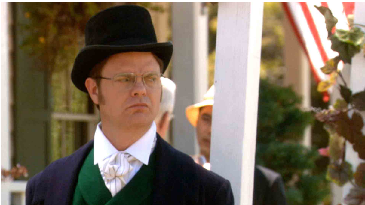
Figure 1: Announcing guests as they enter is the height of decorum and a must. The more volume displayed, the more honor is bestowed upon everyone present. [3]

Following [2], success in the office can be achieved following Equation 1: