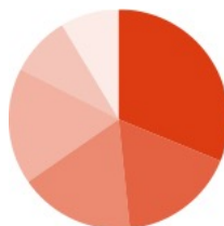
Figura 1.1: Nombre de la gráfica 1

labore et dolore magna aliqua. Ut enim ad minim veniam, quis nostrud exercitation ullamco laboris nisi ut aliquip ex ea commodo consequat. Duis aute irure dolor in reprehenderit in voluptate velit esse cillum dolore eu fugiat nulla pariatur. Excepteur sint occaecat cupidatat non proident, sunt in culpa qui officia deserunt mollit anim id est laborum.