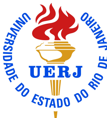
Ilustração 2 – Um grande texto a ser exibido.