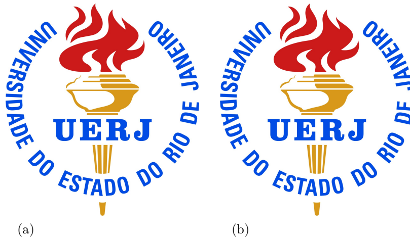
Ilustração 1 – Um grande texto a ser exibido.

Legenda: Uma legenda: (a) esquerda, (b) direita.