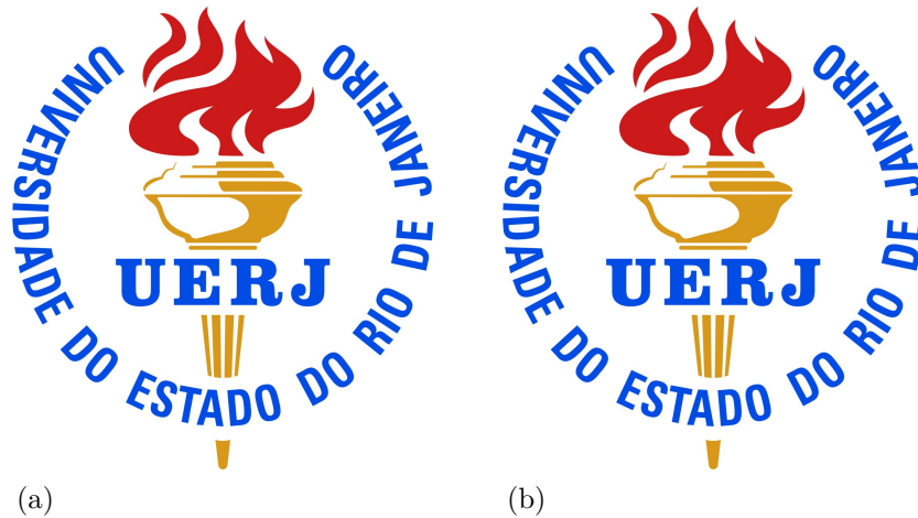
Figura 1 – Um grande texto a ser exibido.

Há trabalhos que se caracterizam por serem não conclusivos e, nesse caso, a parte final poderá ter outras denominações como: considerações finais, a título de conclusão ou similares.