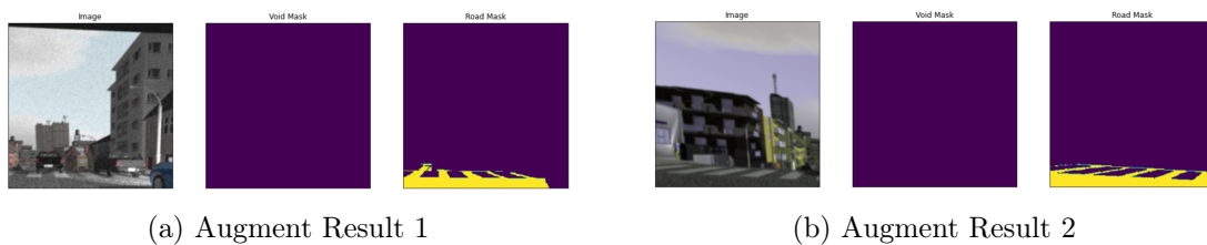
Gambar 1: Augmentation Samples

Berikut ini adalah contoh cara untuk memuat multi-gambar.