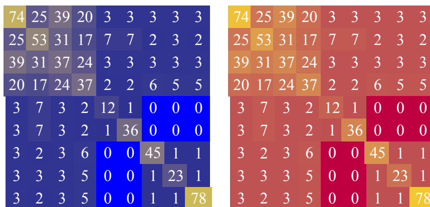
图 5-2: 图 2 的标题名称

2、对于同一问题使用两个或以上合理模型进行求解。避免出现单纯罗列模型，又不做对比和评价的现象。