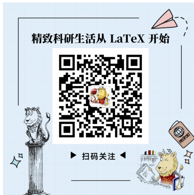
图 4-1: 图 1 的标题名称